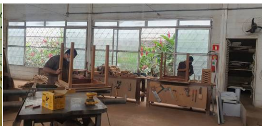
Oficina de Marcenaria

O início do ano letivo no Ceprolim – Centro de Profissionalização Especial Dr. Lincoln Marques da Rocha foi marcado pelo retorno dos trabalhos presenciais apenas com os educandos nas oficinas laborais, e na modalidade da EEJA – Escola Especial de Jovens e Adultos, com as professoras trabalhando presencialmente ministrando as aulas online. Desde março de 2020 as atividades presenciais haviam sido suspensas para todos as modalidades de trabalhos presenciais e neste início de ano, com a autorização da SEDUC - Secretaria Estadual de Educação, seguindo as orientações da Secretaria Estadual de Saúde, a Apae Goiânia optou pelo retorno de 30% de educandos na modalidade presencial apenas nas Oficinas Laborais do Ceprolim - Complexo III.