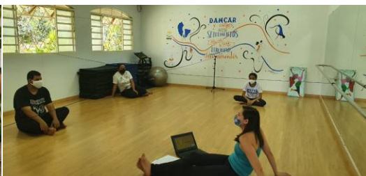
Aula de Dança